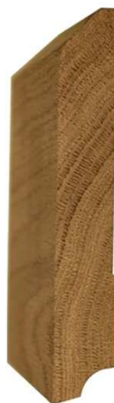
№13 120x20 800 руб/м.п.