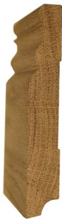
№1 120x20 800 руб/м.п.