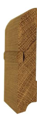
№18 100x20 800 руб/м.п.