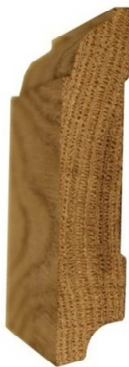
№7 85x20 700 руб/м.п.