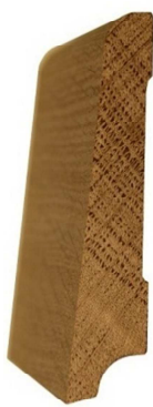
№9 85x20 700 руб/м.п.