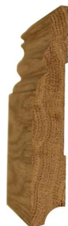
№15 120x20 900руб/м.п.