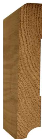
№14 120x20 900руб/м.п.