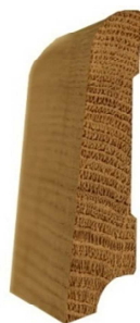
№8 70x20 700 руб/м.п.